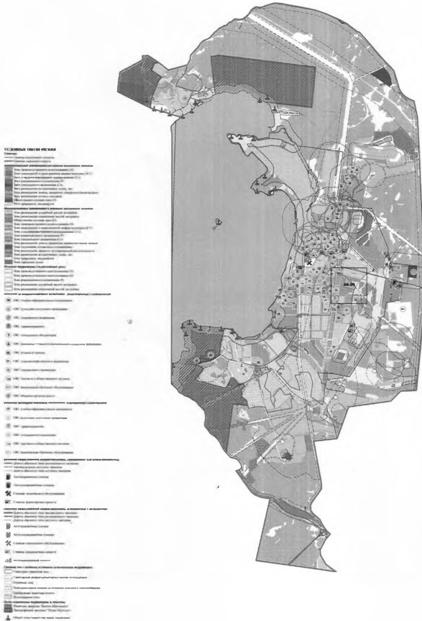
Схема размещения фрагментов на генеральном плане городского округа Среднеуральск