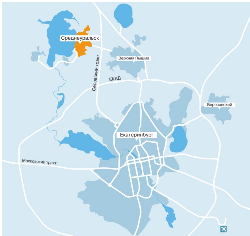
Рисунок 1. Схема расположения городского округа Среднеуральск.

На территории городского округа Среднеуральск расположены посёлок Кирпичный, деревни Коптяки и Мурзинка. От города Среднеуральска населённые пункты расположены на расстоянии: Кирпичный – 3,5 км. (4 км. - расстояние по дорогам общего пользования), Коптяки – 2,5 (4) км, Мурзинка – 5 (18,5) км. соответственно.